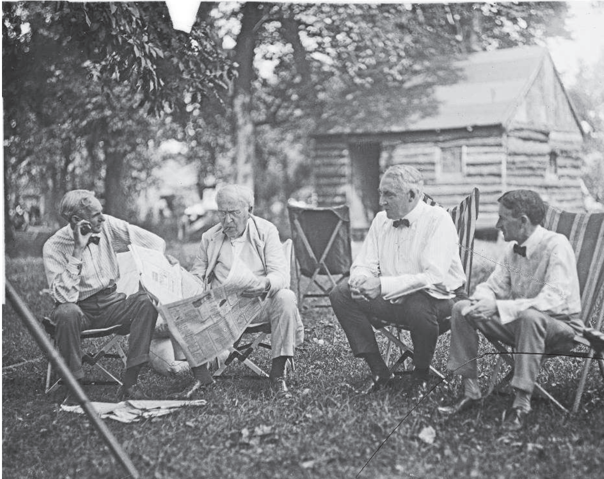
Генри Форд, Томас Эдисон, Уоррен Гардинг и Гарви Файрстоун — титаны автомобильной индустрии во время совместного отдыха в лагере в Пайквилле, Мэриленд.